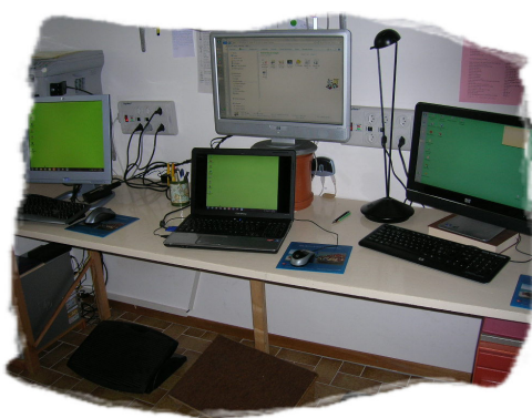
aperçu de ma salle de cours

① Ces cours nécessitent d'avoir suivi le Cours de base ou d'être à niveau de connaissances (peut être jugé lors d'un entretien). Cours en général le matin de 8h30 à 11h30.